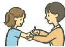
けがのてあても してもらう