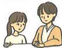
なやみを そうざんする