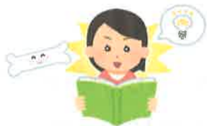
からだのことを まなぶ。